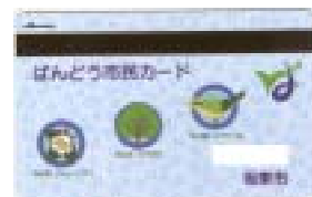
「ばんどう市民カード」

《問合せ》市民サービス課(岩井庁舎/内線1722、1724) 窓口センター(猿島庁舎/内線2208、2209)