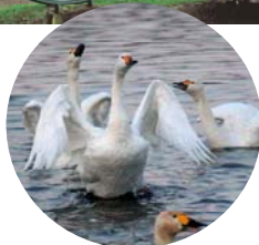
菅生沼に飛来するコハクチョウ