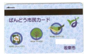
▲ばんどう市民カード (印鑑登録証)