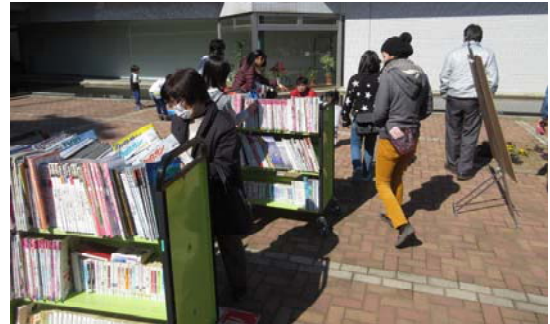
ブックリサイクル