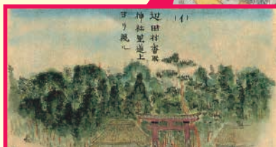
迅速測図に描かれた辺田香取神社の鳥居(明治16年)