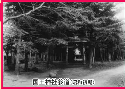
国王神社参道(昭和初期)