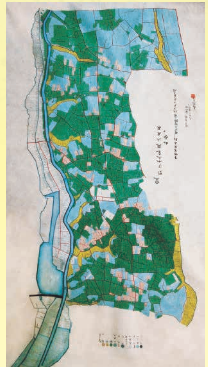
猿島郡神田山村縮図(明治13年) ※図面上が北方向