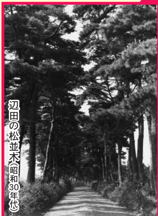
辺田の松並木(昭和30年代)