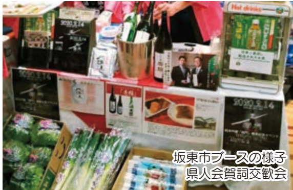
坂東市ブースの様子 県人会賀詞交歓会

で、坂東物産展「将門ぶくしin銀座」を開催。将門の名を冠する郷土特産品のほか、数量限定で復刻販売した「純米吟醸将門」の試飲・販売会を実施しました。また、併設しているレストラン「BARA dining」（バラダイニング）では、JA岩井と野村産業(株)の協力により、さしま茶葉を使用したプリンや、新鮮野菜を生かしたサラダなどのご当地限定メニューを提供しました。市では、今後も知名度アップと魅力発信のため、県内外で特産品のPR活動を積極的に実施していきます。