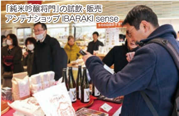
「純米吟醸将門」の試飲・販売 アンテナショップIBARAKI sense