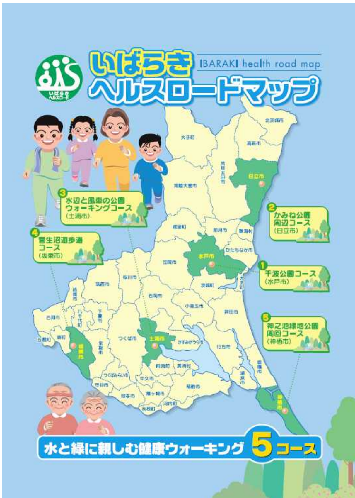
資料：茨城県立健康プラザ