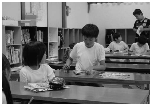
▲放課後児童クラブではそれぞれが学習や集団活動を行っています

市では、労働等により昼間保護者または同居の家族が家庭で保育が困難な小学1年生～3年生の児童を対象に、放課後児童クラブを開設しています。