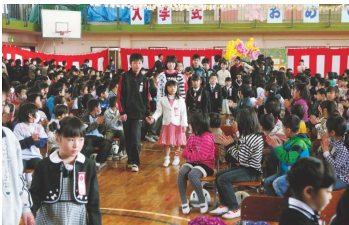
▲市内小学校入学式 新入生は13校で454人でした。〈4月9日〉