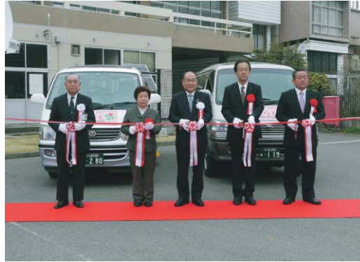
▲デマンドタクシーの運行開始 デマンドタクシーの利用には予約が必要で、大人300円、小学生以下100円。運行開始に伴い、コミュニティバスの運行は幹線道路を中心とする路線に変更されました。〈4月2日〉