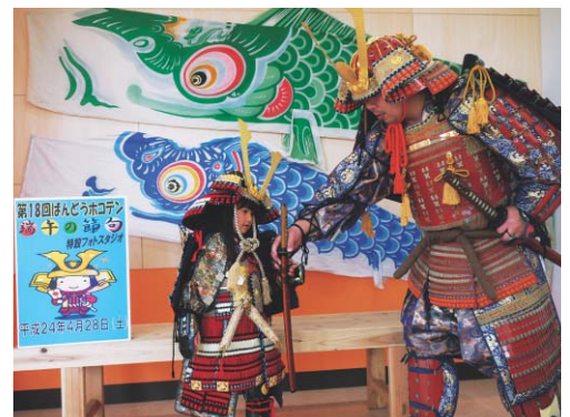
▲ばんどうホコテン 子どもの日を先取りし、鯉のぼりが商店街に掲げられ、鎧姿での撮影会が開催されました。〈4月28日〉