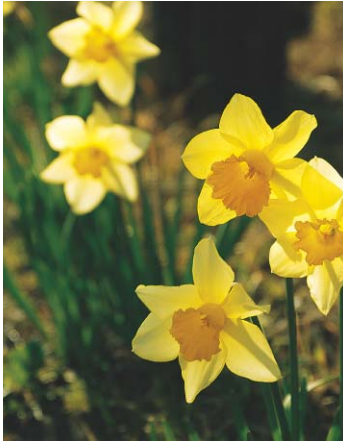
▲ボランティアの皆さんに逆井城跡公園に植えていただいた水仙が美しい花を咲かせました。 〈4月2日〉