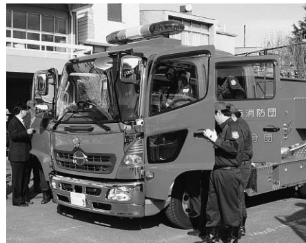
▲装備の確認をする団員の皆さん

消防団第1・8分団に最新式の消防車が配備されました。これまでの車両は、18年間にわたり活躍しました。