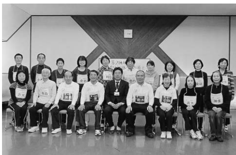
▲シルバーリハビリ体操指導士の資格を取得された皆さん