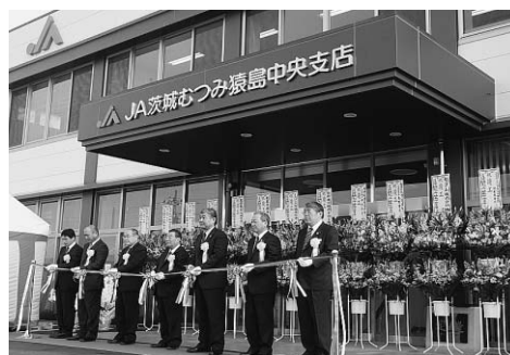
▲猿島庁舎隣に開店したJA茨城むつみ猿島中央支店

建設が進められていたJA茨城むつみ猿島中央支店が竣工、営業が開始されています。猿島中央支店は、猿島地域の生子菅支店、逆井山支店、沓掛支店を統合した、営農・経済関連機能、信用・共済機能を有した総合支店で、現金自動受払機も設置されています。これにともない、これまでの3支店は廃止となりました。なお、猿島地区営農センターに変更はありません。市では、JAとの連携を図りつつ、農業のさらなる発展を推進していきます。