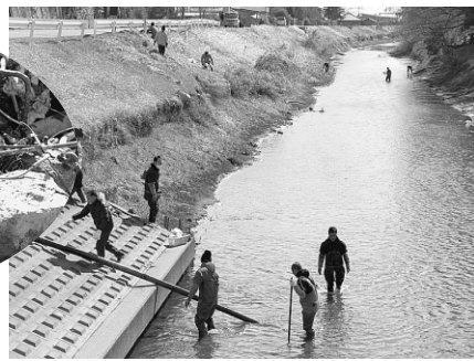
▲川に捨てられたゴミを拾い上げるボランティアの皆さん