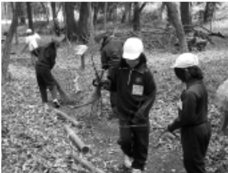
▲里山の清掃活動をする児童たち

七郷小学校は、茨城県自然博物館や地元の七郷里山会などの環境保全団体と連携して、長年にわたり菅生沼や里山を活用した環境学習に取り組んでいます。毎年11月には、学校を挙げて自然博物館が主催する「菅生沼エコアップ大作