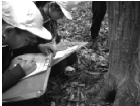
▲里山で植物の観察をする児童たち

戦」にも参加しています。また、授業や保全活動には博物館だけでなく、七郷里山会やPTAなどを巻き込んだ地域ぐるみの活動を展開しています。