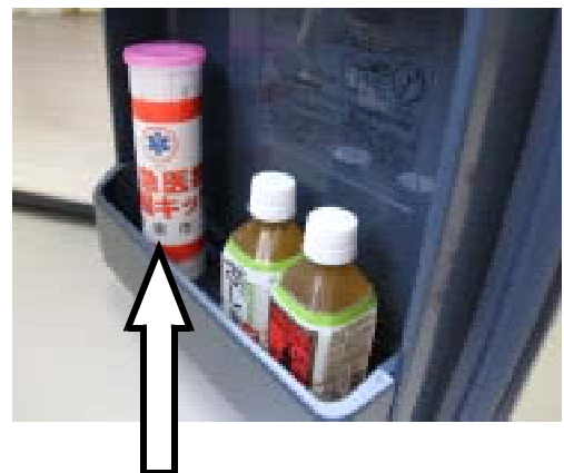
冷蔵庫の中の救急医療情報キット