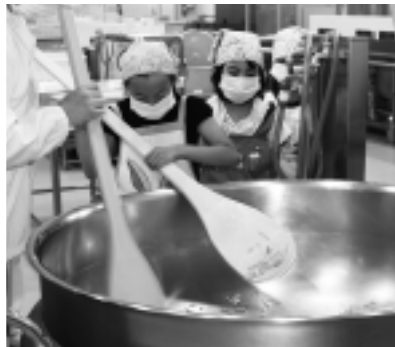
▲一生懸命調理するこどもたちの様子

ちびっ子料理教室が岩井学校給食センターで開催され、小学3年生から5年生のちびっ子29人が昼食づくり