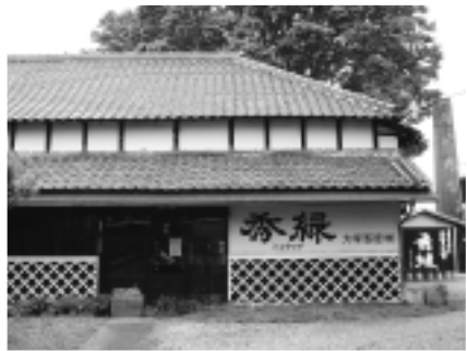
▲歴史的建造物を活かした集客施設として整備します