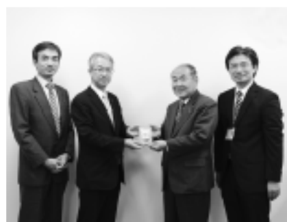
▲防犯ブザーを手渡す常陽銀行の保原支店長