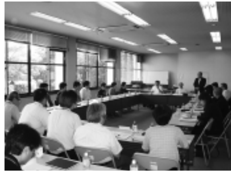
▲新制度に向け議論が交わされました

6月20日、猿島庁舎で第3回子ども・子育て会議を開催しました。 昨年行ったニーズ調査の結果から、保育園や放課後児童クラブなどの利用希望者の見込みや、来年度から始まる子ども・子育て新制度の事業計画を作成するための柱となる運営に必要な基準などについて話し合いました。 新制度をスタートさせるために、これからも、教育保育・子育て支援の充実を図るための協議を重ねていきます。