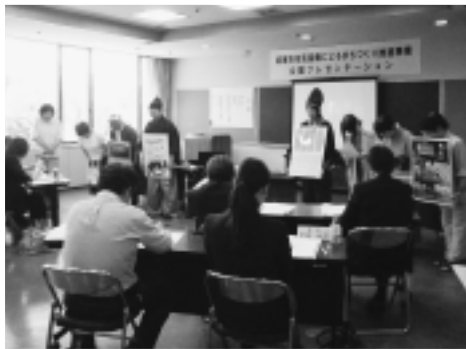
▲各団体による事業のPRが行われました

6月14日、岩井公民館で、平成26年度坂東市市民協働によるまちづくり推進事業の補助金を交付する団体を決める