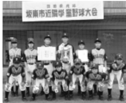
▲大会準優勝のレッドキャップスの皆さん