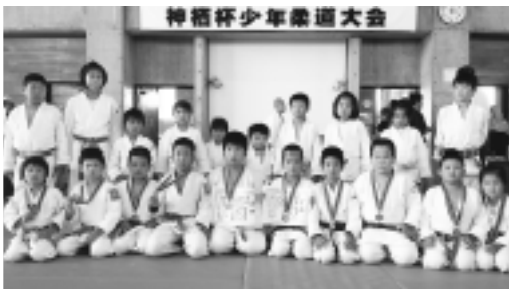
▲大会で活躍した選手の皆さん