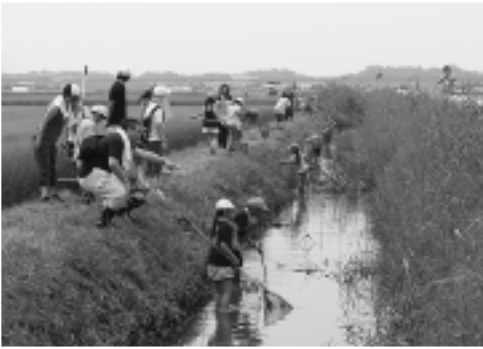
▲生き物調査をする児童たち

茨城県自然博物館学芸員の土屋先生から指導を受けた後調査を開始、捕獲網や仕掛け網で魚を捕獲すると大きな歓声が上がっていました。