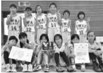
▲大会準優勝の岩井第一MBCの皆さん