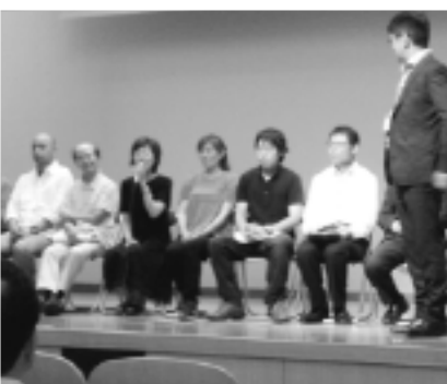
▲発表後意見交換が行われました

わくわくフェスタは、市民団体のみなさんによる、よりよいまちづくりのための取り組みや活動状況、問題点、改善点など、エピソードを交えながら発表が行われました。これからも、このような機会を設け、各種市民団体のみなさんの連携を図るとともに、市民のみなさんとの協働の輪を広げていきます。