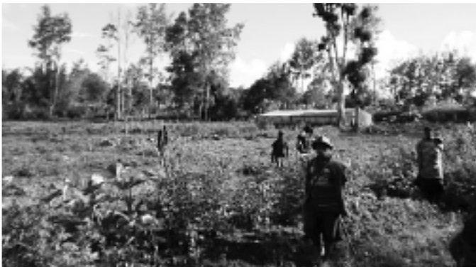
▲タリ市の農業について視察を行いました