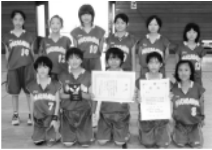
▲大会4位の南MBCの皆さん