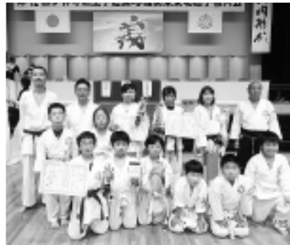
▲大会で活躍した選手の皆さん