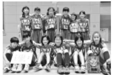
▲大会優勝の岩井第一MBCの皆さん