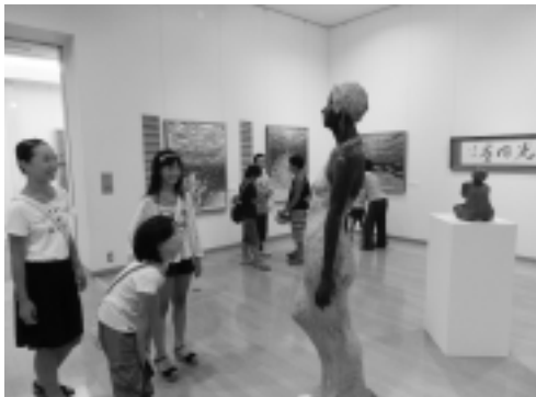
▲展示されている各分野の美術作品