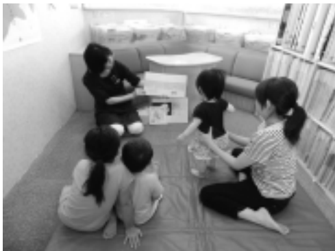
▲おひざの上のおはなし会の様子