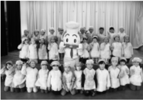
▲パティシエおじさんとの記念撮影