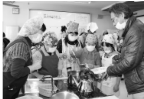
▲みんなで協力して赤もちを作りました

2月8日、猿島公民館で、第9回英語インタラクティブフォーラムが開催されました。 大会には、坂東市及び近隣の中学校15校から90人の生徒が参加し、3人1組で指定されたテーマにそって英会話をを行い、語学力などを競いました。 中学生とは思えないジェスチャーや英語力を発揮するなど、熱戦が繰り広げられました。