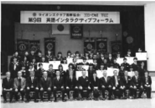
▲大会で優秀な成績をおさめた皆さん

1月29日、岩井第二分館研修が行われ、分館委員のかた28人が県警察本部や茨城空港を訪れました。 自分たちの住む茨城についていろいろなことを知るとともに、参加されたかたの交流にも繋がったようです。 岩井第二分館では、今後も地域が豊かになるような研修や交流を積極的に進めていくとのこと