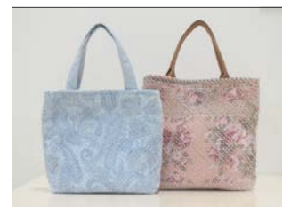
スラッシュキルト

開催場所 さしまクリーンセンター寺久 リサイクルプラザ 参加資格 坂東市・境町・古河市・五霞町に在住または 在勤の方 申込・問合せ さしまクリーンセンター寺久 リサイクルプラザ (☎0297-20-9980)