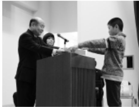
▲検定合格者を表彰しました

市では、各種検定試験(漢字・数学・英語検定)に小学1年生から中学3年生までがチャレンジし、1人1検定以上の合格による「検定取得率日本一」を目指しています。