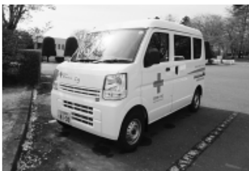
▲今回配備された赤十字救援車

赤十字救援車配備 3月30日、日本赤十字社茨城県支部から赤十字救援車が配備されました。 赤十字救援車は、火災や風水害などの被災者救援のほか、救援物資の配布や社会福祉活動に活用されます。 また、市では、みなさんからご協力いただいた赤十字活動資金を活用し、災害時に備える毛布や非常食などを購入し備蓄しています。