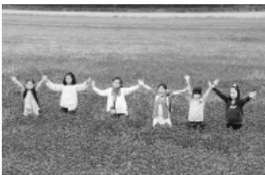
▲真っ赤な絨毯のなかでの記念撮影