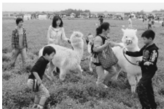
▲アルパカと遊ぶ子どもたち

ダーなどのアトラクションは子どもたちに大人気でした。また、ブーケコンテストやフォトコンテストにはこれまでで最多の応募がありました。