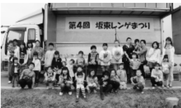
▲ブーケコンテストに参加した皆さん

会場に訪れたかたは、レンゲ畑のなかでの記念撮影や花摘み、模擬店での買い物を楽しんでいました。なかでも、アルパカや小動物とのふれあいコーナー、スペースバウン