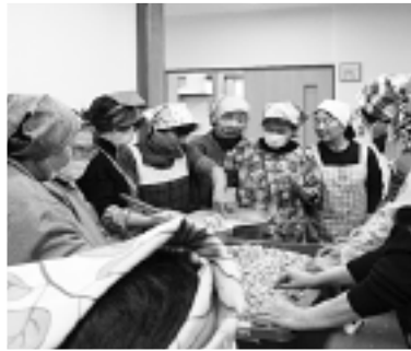
▲七郷分館 みそ作り講習会