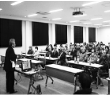
▲七重分館 認知症サポーター養成講座