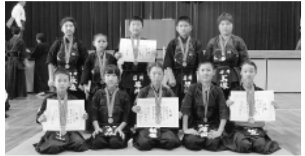
▲大会準優勝の猿島剣友会(後列)と第3位の岩井剣道教室(前列)の皆さん