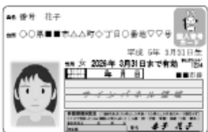
個人番号カードの表面（イメージ）

個人番号カードを希望するかたは、通知カードと同封の交付申請書に写真添付、署名、捺印をして、機構まで郵送してください。平成28年1月から市役所の窓口で交付します。