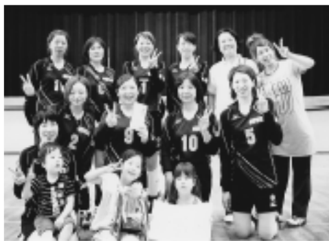
▲大会優勝のCUTEの皆さん