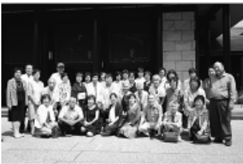
▲能楽鑑賞教室に参加された皆さん

次回の鑑賞教室は、秋頃を予定しています。今後も能楽の普及に努めていけるよう活動していきます。