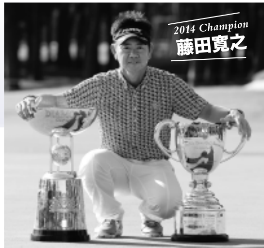
2014 Champion 藤田寛之

ディフェンディングチャンピオン兼ホストプロとしての出場となりますので、今年も優勝争いに加わって試合を盛り上げ、2連勝を狙いたいと思います。『技』はまだまだ磨き続けることが出来ると考えて、日々研鑽しています。ファンの方々と私をサポートしてくれている人たちのためにも、技を磨き続けることで輝いて見えるゴルフが出来ればいい、それを見て「俺も頑張ろう」とか、何かを感じてもらえるゴルフをして行きたいと思います。ぜひ会場にお越しください。