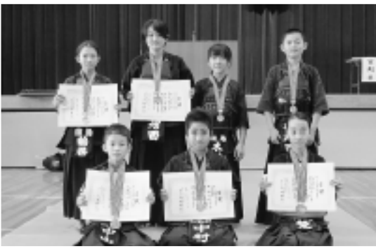
▲大会で活躍した選手の皆さん