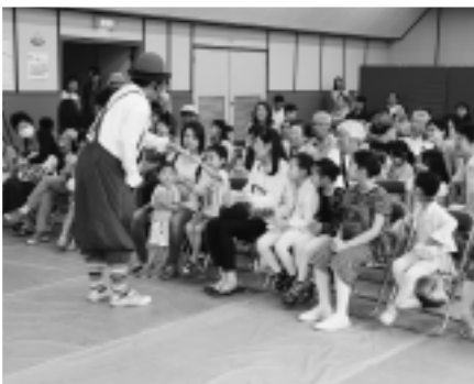
▲バルーンショーに喜ぶ子どもたち

まつりには、公民館で生涯学習活動を進める各種のクラブのみなさんによる発表や展示のほか、バルーンパフォーマンスや新鮮野菜の販売、バザーなどが行われ、多くの人で賑わいました。