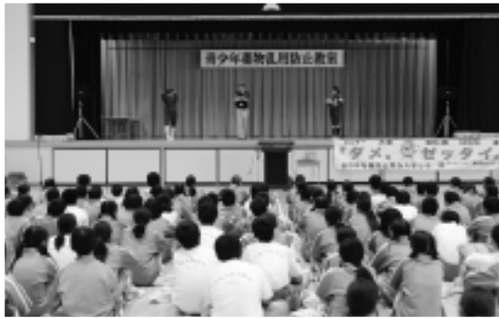
▲猿島ライオンズクラブによる薬物防止の寸劇

を用いるなど、子どもたちはよく理解できたようで、薬物乱用防止に対する意識を高めることができました。