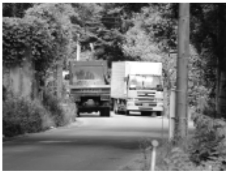
▲県道土浦境線の未改良区間

事は、「結城坂東線バイパスについては、合併支援道路の指定により、市でも分担し整備していただいた。特に、市で計画している坂東インター工業団地へのアクセス道路との交差点までの区間については、市の進捗に合わせて整備を進める。また、土浦境線については、遠隔地の地権者が多く時間がかかっているが、引き続き地権者との交渉を進め、早期の整備を目指している」と、市の協力もお願いしたい。」と、回答がありました。