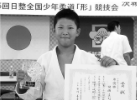
▲茨城県代表として全国大会に出場する猪瀬くん