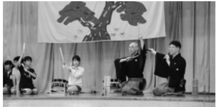
▲子どもたちが能を体験しました

この講座は、岩井第二小学校と岩井第二分館が協働で開催したもので、全校児童約500人が参加。新作能「将門」の映像が流れると、初めて見る能面姿にビックリしたようで、子どもたちから大きな歓声があがっていました。 また、子どもたちが笛・小鼓・大鼓・太鼓を実際に体験したり、能の先生方による謡や仕舞、お囃子を鑑賞するなど、日本の伝統文化に触れる貴重な機会となったようです。