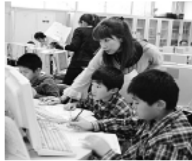
▲岩井第二分館 NHKぼうさいマップ出張出前講座