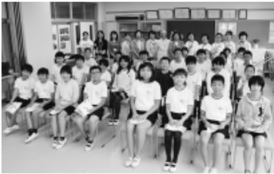
▲薬物防止指導員、更生保護女性会と子どもたち