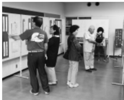
▲多くの作品が展示されました