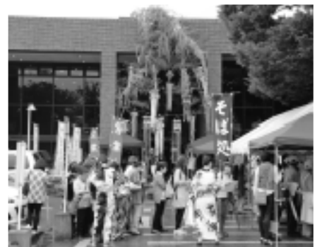
▲会場入口に設置された七夕飾り