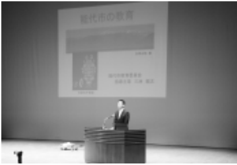
▲能代市の教育の特色についての講演も行われました