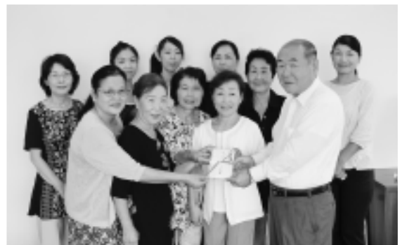
▲募金を手渡すフラフレンズ坂東の皆さん