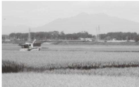
▲美田が広がる現在の 飯沼新田