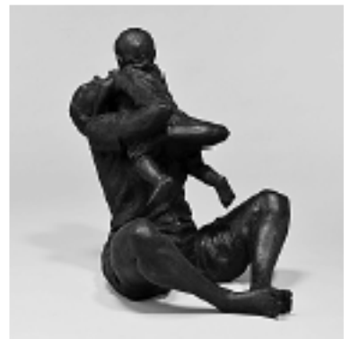
▲『娘が いやいやを覚えた』 市役所1階ロビーで展示中