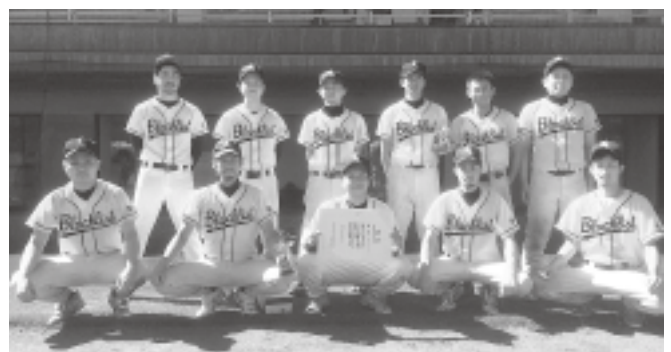
▲大会優勝のBLACK LISTの皆さん