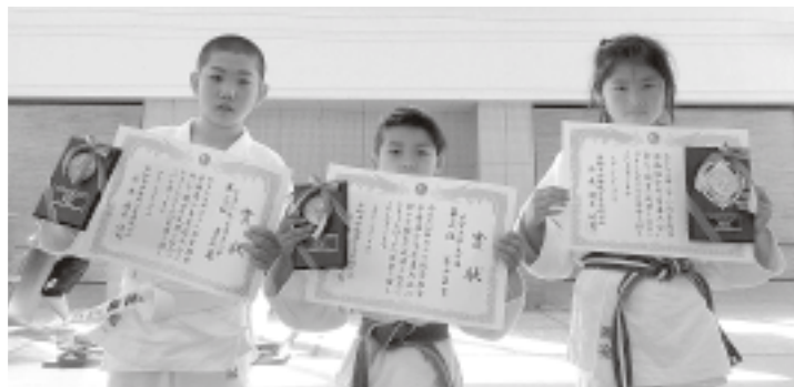
▲大会で活躍した選手の皆さん

平成29年度 軟式野球春季大会 とき 6月4日 ところ 岩井球場 優勝 BLACK LIST 準優勝 MONKEYS 第3位 熱隊夜 マリナーズ