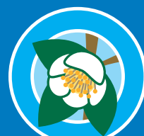
市の花【チャノハナ】