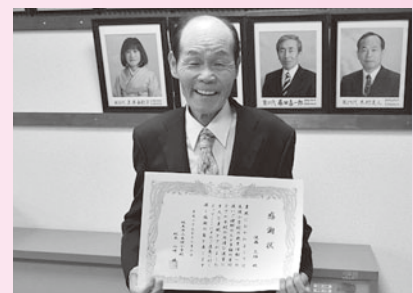
▲小学校より感謝状が贈られました