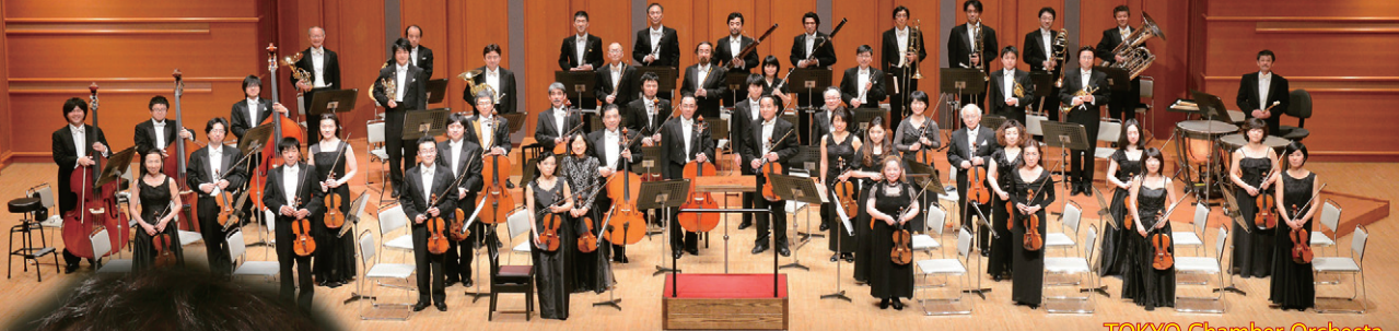
TOKYO Chamber Orchestra