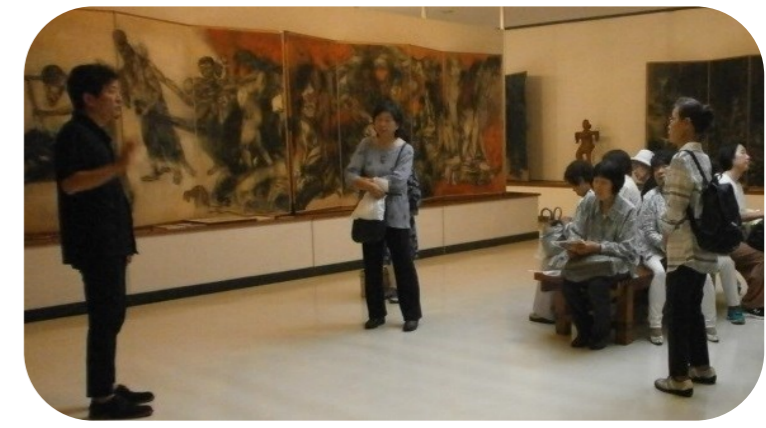
原爆の図 丸木美術館(埼玉県東松山市)