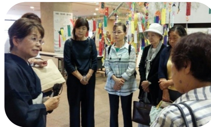
国立女性教育会館(埼玉県嵐山町)