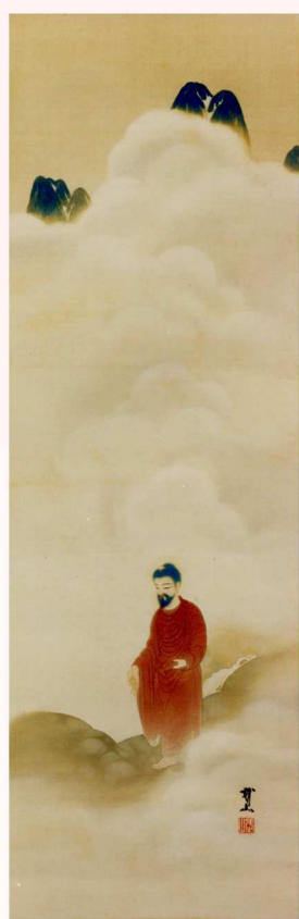
木村武山「出山釈迦」