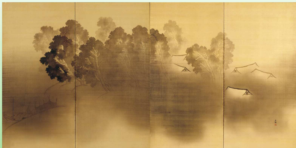
横山大観「暁色」(屏風)