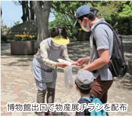
博物館出回で物産展チラシを配布

ななごう笑顔の里は、同博物館との連携強化を目的に、七郷地区女性10人の発起人のみなさんと分館長などが設立。物産展では、七郷地区で生産されたトマトやブロッコリー、大根、コメなどを販売したほか、市が作成した観光ガイドやマップを配布いただき、多くの来館者などで賑わいました。