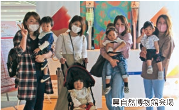
県自然博物館会場