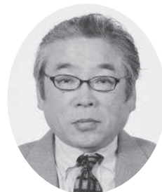
ふじの むのる 藤野 稔 議員

* マイナポータル「ぴったりサービス」…「マイナポータル」とは、政府が運営している行政機関からの情報をまとめたインターネット上の窓口です。その中の「ぴったりサービス」は、行政手続の検索や電子申請などができるサービスです。