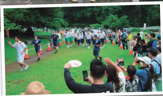
7月5日、茨城県自然博物館でつないだ 東京2020オリンピック聖火リレー