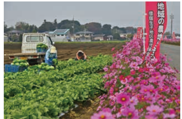
坂東コスモス街道