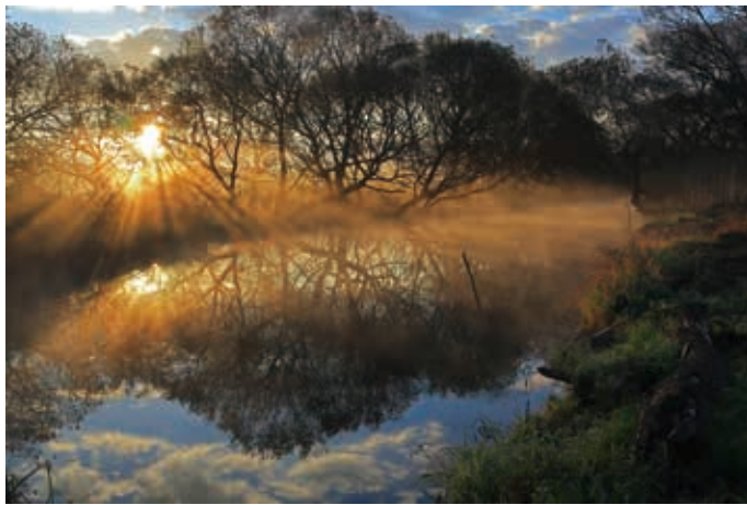
静寂に射す (菅生沼)