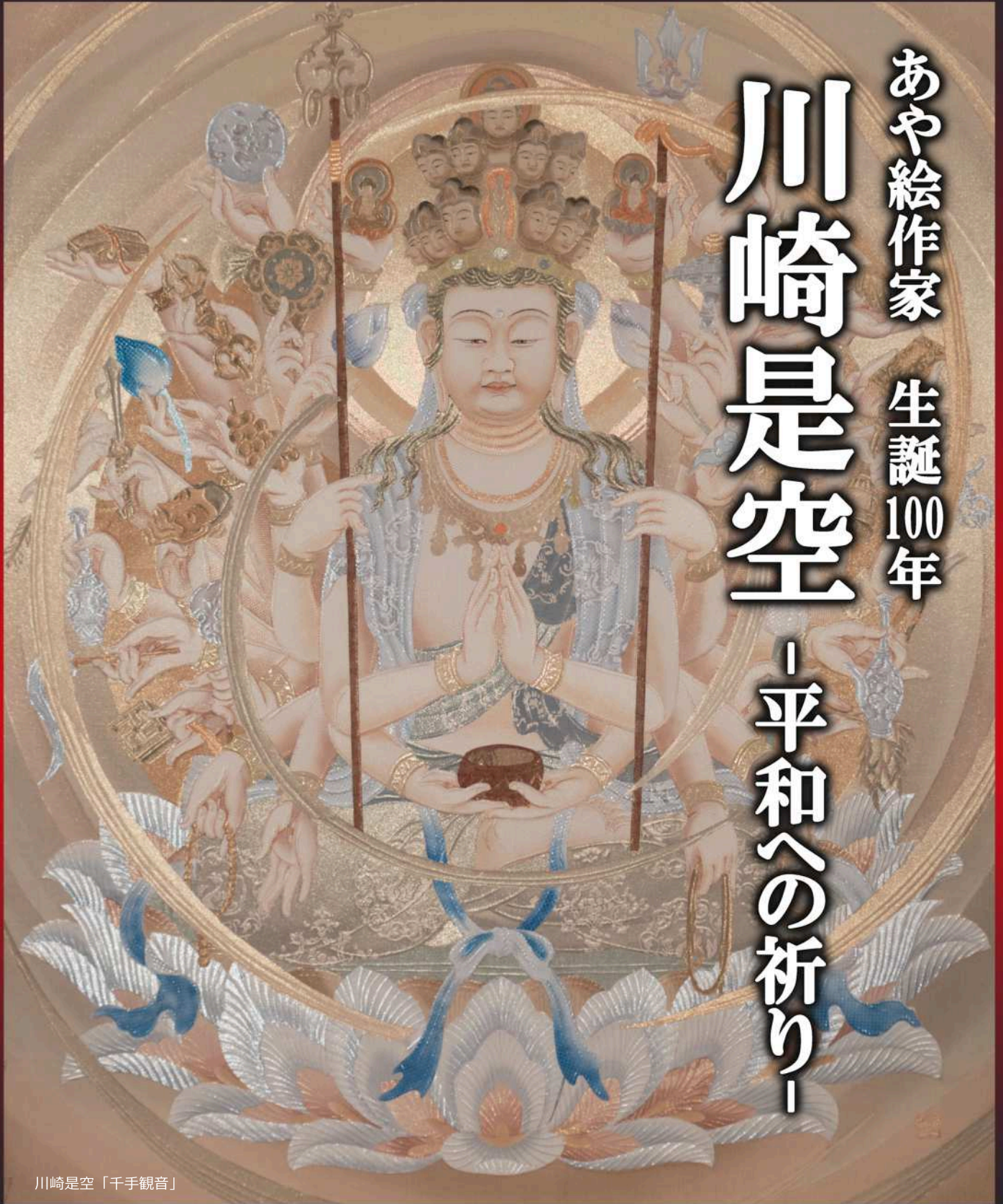
川崎是空「千手観音」