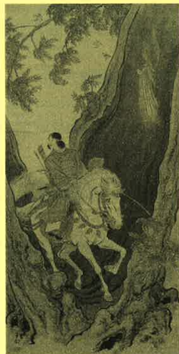
むく 棕の木の奇跡 (二世五姓田芳柳)