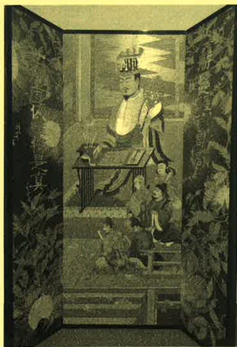
しょうまんぎょうこうさんぞう 聖徳太子勝鬘経講讃像 (川崎是空)