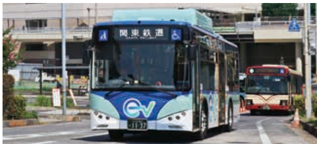
▲ 導入された一般路線用大型電気バス

環境に優しい 大型電気バス (EVバス) を県内で初めて導入し、現在、守谷営業所管内 (坂東市を含む) で2台運行されています。静かで揺れの少ない乗り心地で、窓側の客席には USB 電源が設置されています。また、災害時には電源供給車として活用できます。