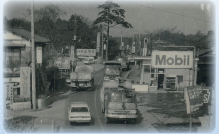
昭和47年頃の南中学校入口の交差点付近

記憶の中に埋もれてしまった市内の風景や暮らしの様子を、皆様からお寄せいただいた古写真や、坂東市ほか各機関が保管してきた行政資料等とともにふりかえります。ふるさとのなつかしの風景や魅力を訪うていただき、うつりゆく未来に想いを馳せてみてはいかがでしょうか。