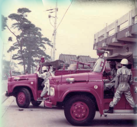
岩井消防署の出動訓練風景 (昭和50年代・坂東消防署蔵)