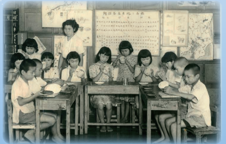
逆井山村立東小学校の陶器づくりクラブで行われていた「東校焼き」（昭和27年頃）