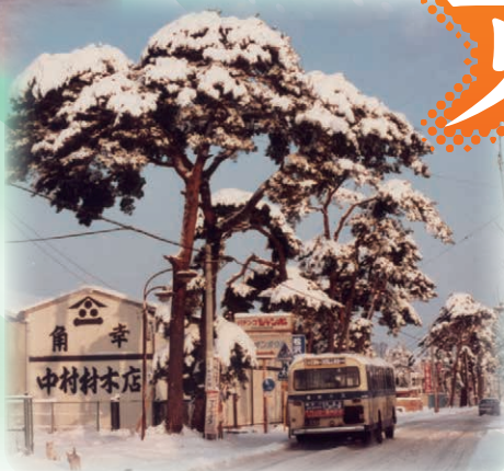
雪化粧した辺田の松並木 (昭和59年・個人蔵)