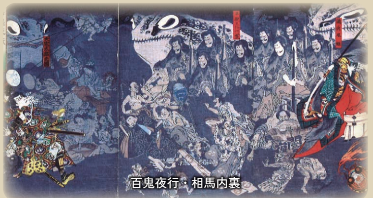
百鬼夜行・相馬内裏