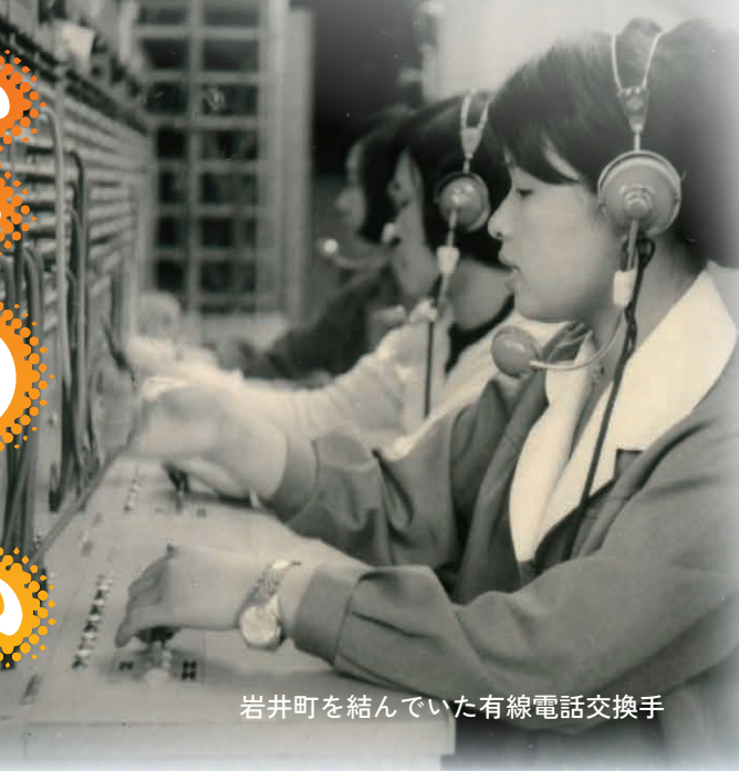
岩井町を結んでいた有線電話交換手