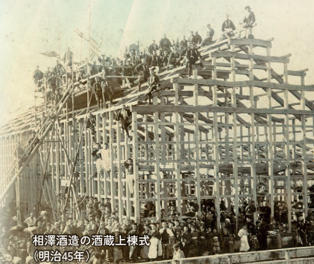
相澤酒造の酒蔵上棟式 (明治45年)