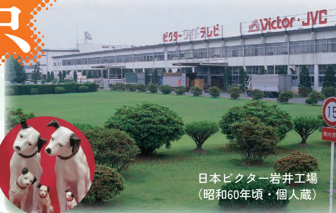
日本ビクター岩井工場 (昭和60年頃)