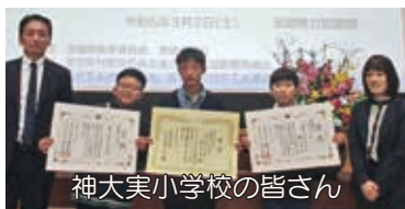
神大実小学校の皆さん