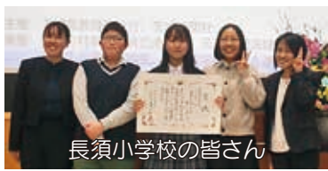
長須小学校の皆さん