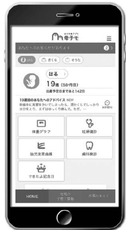
▲アプリ画面イメージ

妊娠中の体重を入力すると、妊娠週数別の推定体重が自動でグラフ化され、簡単に変化を確認できます。出産後でも、お子さんの身長・体重を入力すると発育曲線が表示され、成長を一目で確認できます。