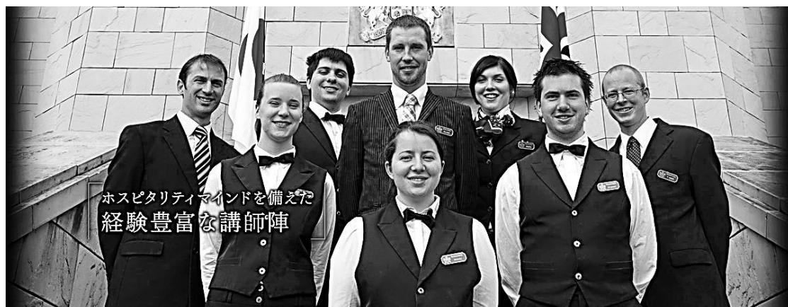
ホスピタリティマインドを備えた 経験豊富な講師陣