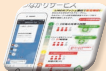
スマートフォンアプリ