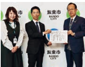
キャノンエコロジージャインダストリー株式会社

3月27日、献血功労団体としてキャノンエコロジージャインダストリー株式会社、坂東市商工会女性部・青年部に感謝状が伝達されました。感謝状は、永年にわたり献血を推進している団体や、献血に協力している団体に日本赤十字社茨城県支部長から贈られるものです。おめでとうございます。