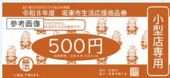
小型店専用券（オレンジ）