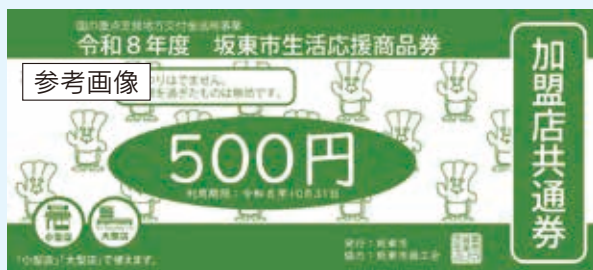
加盟店共通券（グリーン）

物価高騰の影響を受けている市民生活を応援するとともに、地域経済の活性化を図ることを目的として、市民の皆様には坂東市生活応援商品券を配布します。