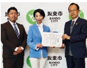
坂東市商工会女性部・青年部