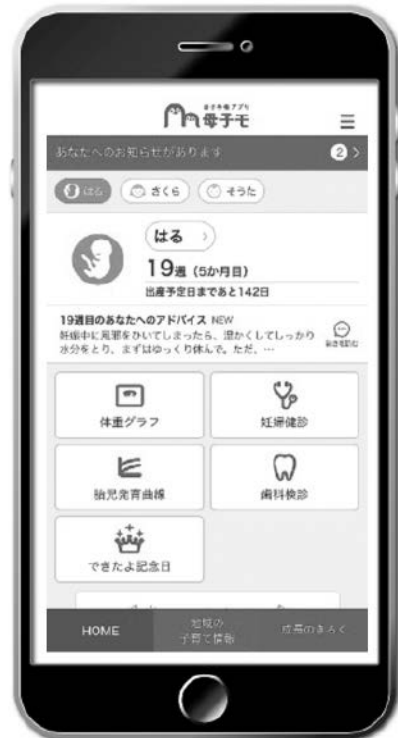
▲アプリ画面イメージ